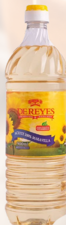
ACEITE MARAVILLA DE REYES 900ML