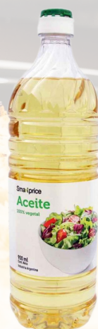
ACEITE VEGETAL SMART 900ML