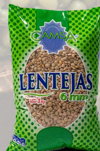
LENTEJAS CAMSA 1K