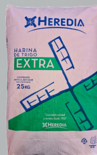
HARINA HEREDIA EXTRA 25K