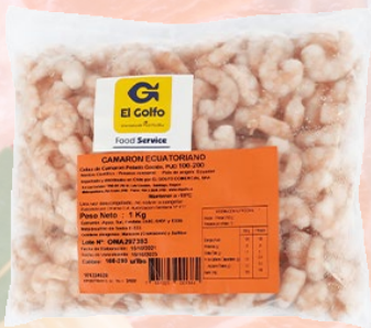
CAMARÓN COCIDO 36/40 ECUATORIANO EL GOLFO 1K