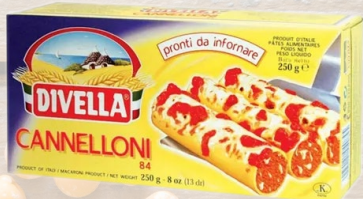
CANNELLONI DIVELLA 500G