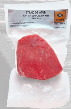
ATÚN STEAK EL GOLFO 1K