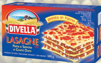
LASAGNA DIVELLA 500G