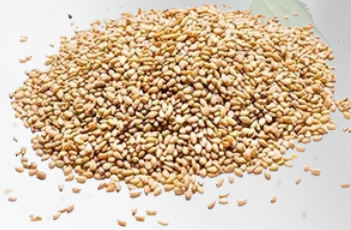
SÉSAMO TOSTADO 1K