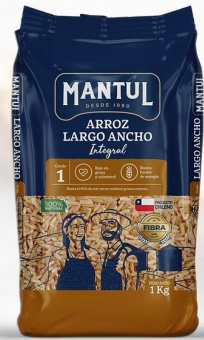
ARROZ G1 MANTUL INTEGRAL LARGO ANCHO 1K