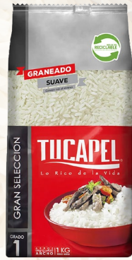
ARROZ TUCAPEL G1 SELECCIÓN 1K