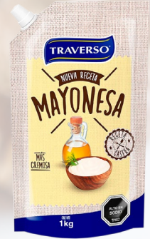
MAYONESA TRAVERSO 1K