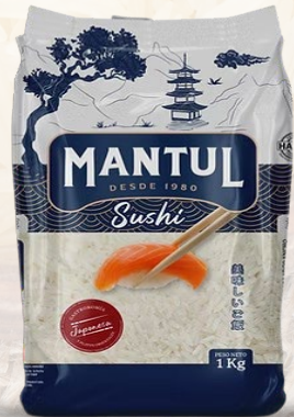
ARROZ G2 MANTUL SUSHI 1K