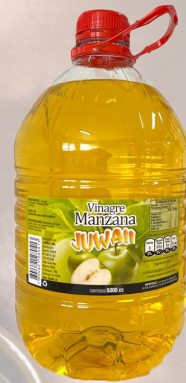
VINAGRE DE MANZANA JUWAI 5LT