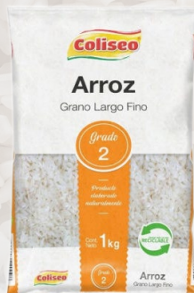
ARROZ G2 COLISEO LARGO FINO 1K