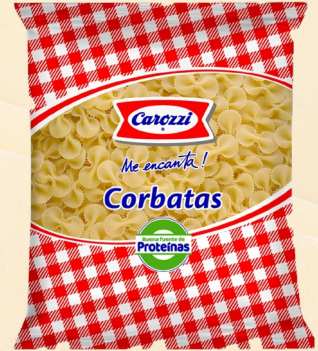
CORBATA 80 CAROZZI 400G