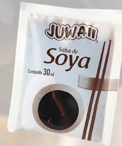
SACHET DE SALSA DE SOYA 30ML