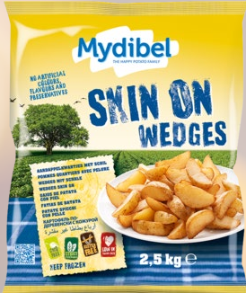
PAPAS FRITAS GAJO CON PIEL 1K