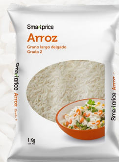
ARROZ G2 SMART PRICE LARGO FINO 1K