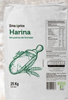
HARINA SMART PRICE 25K