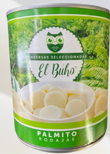
PALMITO RODAJAS 800G