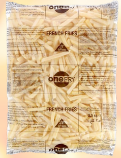
PAPAS FRITAS MCCAIN CASERO 12MM 1K