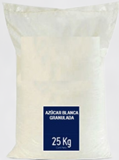
AZÚCAR GRANULADA 25K