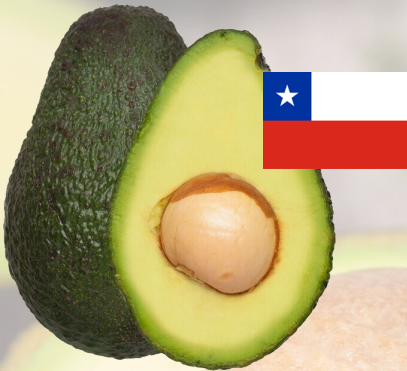
PALTA HASS CHILENA SEGUNDA 1K