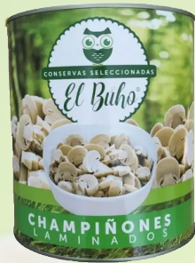
CHAMPIÑONES EL BUHO 2840G