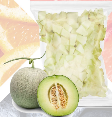
MELÓN IQF T&T 1K