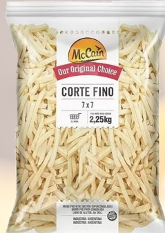
PAPAS FRITAS CORTE FINO 7MM 1K