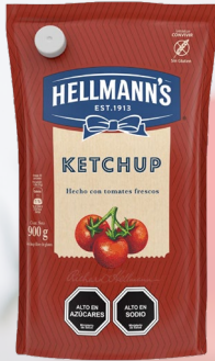
KETCHUP HELLMANN'S 1K