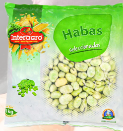
HABAS INTERAGRO 1K