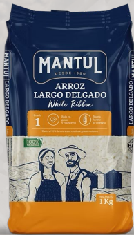
ARROZ G1 MANTUL LARGO FINO 1K