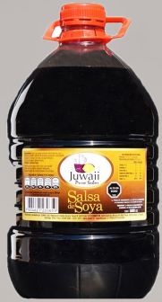
SALSA DE SOYA JUWAI 5LT