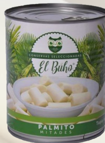
PALMITO MITADES 800G