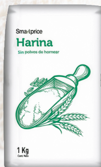
HARINA SMART PRICE 1K