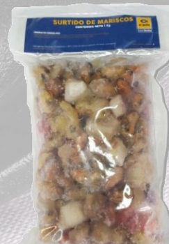
SURTIDO DE MARISCOS EL GOLFO 1K