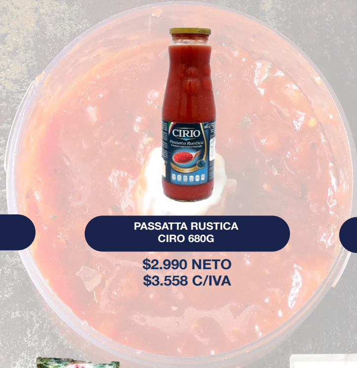
PASSATA RUSTICA CIRO 680G