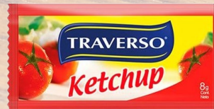
KETCHUP TRAVERSO 8G