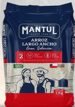
ARROZ G2 MANTUL LARGO ANCHO 1K