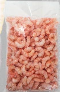
CAMARÓN COCIDO 36/40 1K