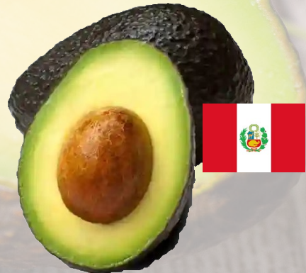
PALTA PERUANA CALIBRE 22-24 1K