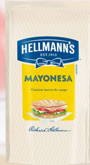
MAYONESA HELLMANN'S 940G