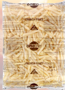
PAPAS FRITAS ONE FRY 9MM 1K