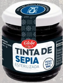
TINTA CALAMAR 90G