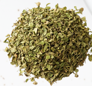
OREGANO DESHIDRATADO 250G