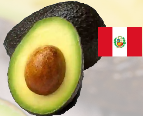
PALTA HASS PERUANA CALIBRE 14-18 1K