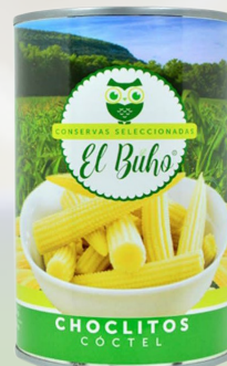
CHOCLITOS CACKTAIL 425G