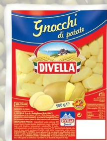
GNOCCHI DIVELLA 500G