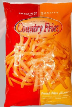
PAPAS FRITAS COUNTRY FRIES 10MM 1K