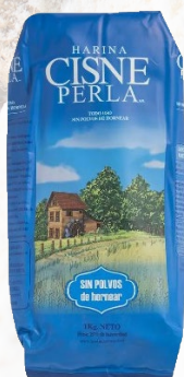
HARINA PERLA 1K