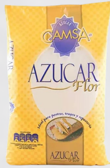
AZÚCAR FLOR CAMSA 1K