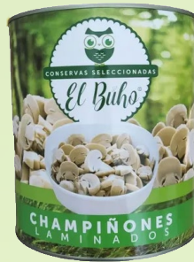
CHAMPIÑONES EL BUHO 400G