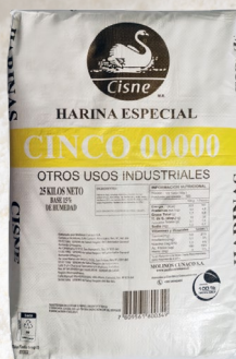
HARINA CINCO CERO 25K