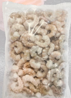
CAMARÓN CRUDO DESVENADO 36/40 1K