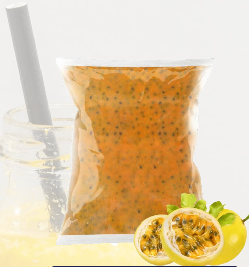
PULPA MARACUYA C/P T&T 1K