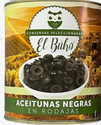
ACEITUNAS NEGRAS RODAJAS 3000G