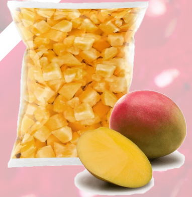
MANGO TROZO IQF T&T 1K