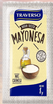
MAYONESA TRAVERSO 8G