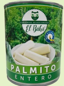
PALMITO ENTERO 800G