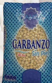
GARBANZOS SIN PIEL CAMSA 1K