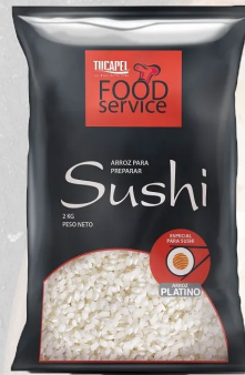
ARROZ TUCAPEL G2 SUSHI 1K