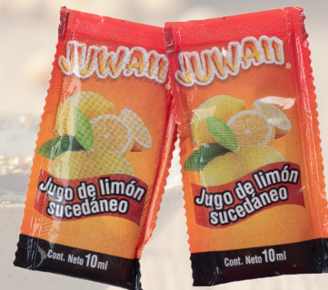
SACHET DE LIMON 10ML