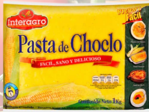
PASTA DE CHOCLO INTERAGRO 1K