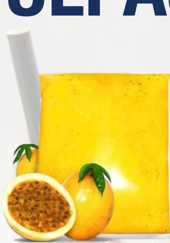
PULPA MARACUYA T&T 1K