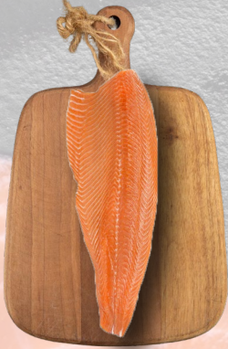
SALMÓN FILETE PREMIUM SIN PIEL EL GOLFO 1K