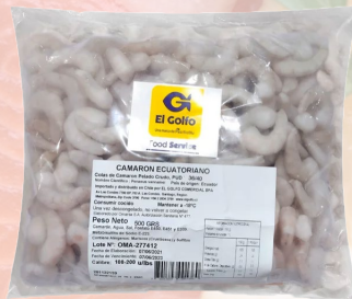
CAMARÓN CRUDO DESVENADO 36/40 ECUATORIANO EL GOLFO 1K