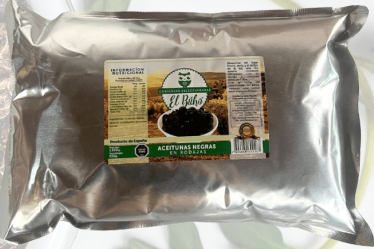
ACEITUNAS NEGRAS RODAJAS 1800G