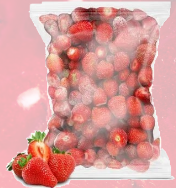
FRUTILLA IQF T&T 1K