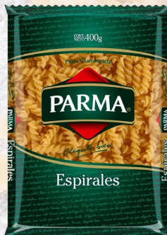
ESPIRALES PARMA 400G