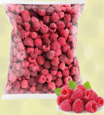
FRAMBUESA ENTERA IQF T&T 1K