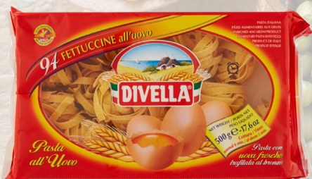
FETTUCCINE DIVELLA 500G