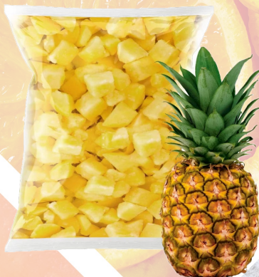
PIÑA TROZO IQF T&T 1K