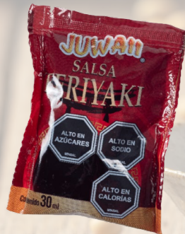
SACHET DE SALSA TERIYAKI 30ML