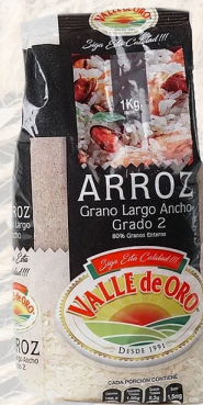
ARROZ G2 VALLE DE ORO LARGO ANCHO 1K