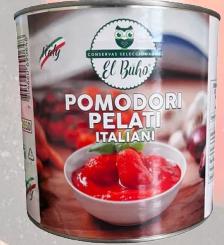
POMODORI PELATI 800G