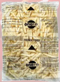
PAPAS FRITAS ONE FRY 12MM 1K