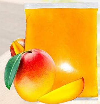
PULPA MANGO T&T 1K