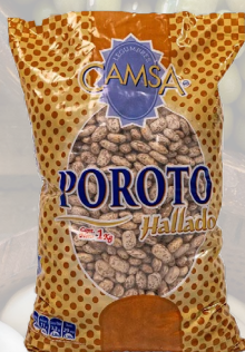
POROTOS CAMSA 1K