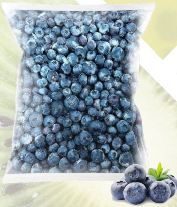
ARÁNDANOS IQF T&T 1K