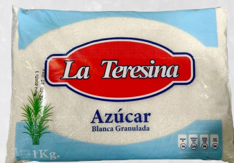
AZÚCAR G2 TERESINA 1K