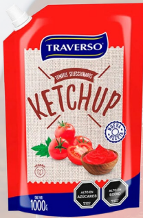
KETCHUP TRAVERSO 1K