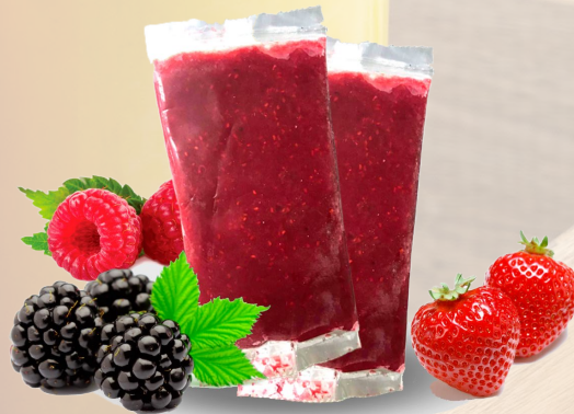
PULPA FRUTOS ROJOS T&T 1K