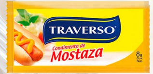
MOSTAZA TRAVERSO 8G