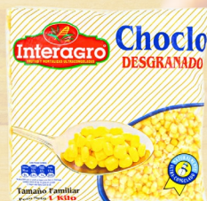
CHOCLO DESGRANADO INTERAGRO 1K