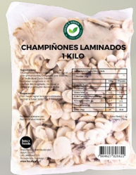
CHAMPIÑONES LAMINADOS INTERAGRO 1K