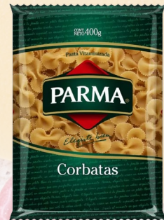
CORBATAS PARMA 400G