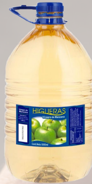
VINAGRE DE MANZANA HIGUERILLAS 5LT