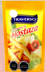
MOSTAZA TRAVERSO 1K