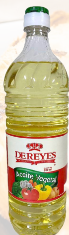
ACEITE VEGETAL LOS REYES 900ML