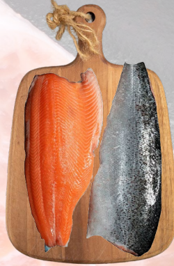
SALMÓN FILETE PREMIUM CON PIEL EL GOLFO 1K