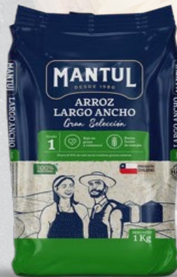
ARROZ G1 MANTUL LARGO ANCHO 1K