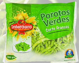
POROTOS VERDES INTERAGRO 1K