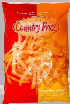
PAPAS FRITAS COUNTRY FRIES 12MM 1K