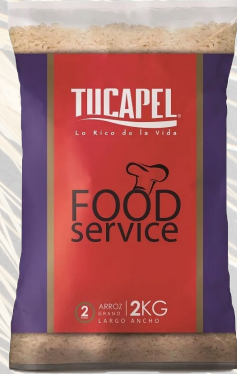
ARROZ TUCAPEL G2 FOOD SERVICE 1K