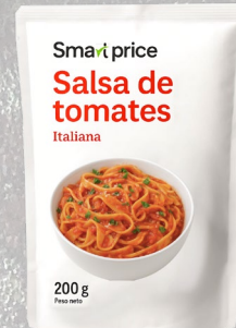
SALSA DE TOMATE SMART PRICE 200G