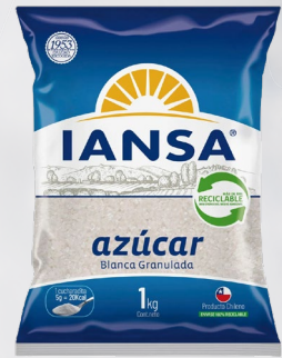
AZÚCAR IANSA 1K