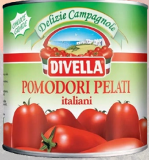
TOMATES PELADOS 2500G