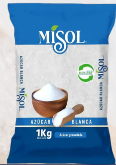
AZÚCAR G2 MISOL 1K