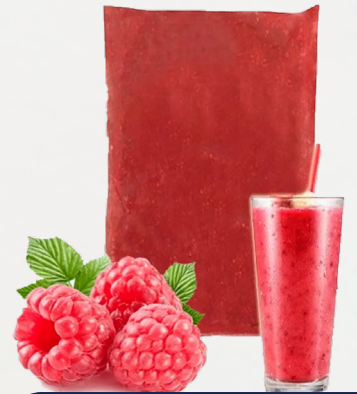
PULPA FRAMBUESA T&T 1K