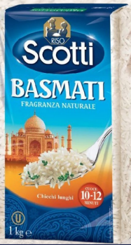
ARROZ ARBORIO BASMATI 1K