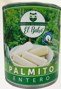
PALMITO ENTERO 400G