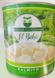
PALMITO RODAJAS 400G