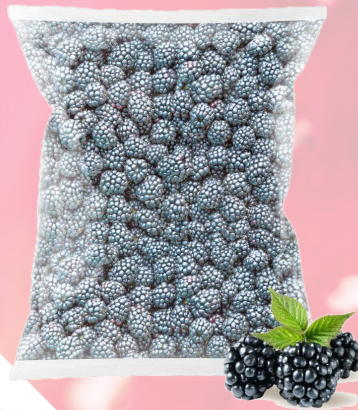
MORA IQF T&T 1K