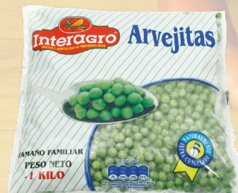
ARVEJAS INTERAGRO 1K