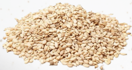
SÉSAMO BLANCO 1K