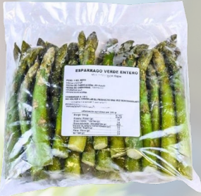
ESPARRAGOS INTERAGRO 1K