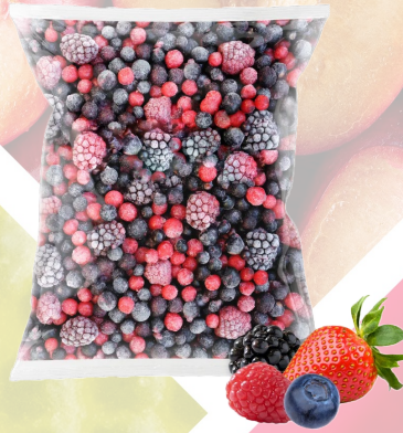
MIX FRUTOS ROJOS IQF T&T 1K