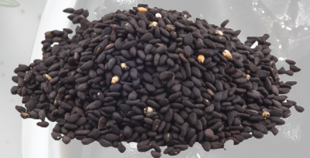
SÉSAMO NEGRO 1K