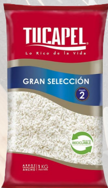
ARROZ TUCAPEL G2 GRAN SELECCIÓN 1K