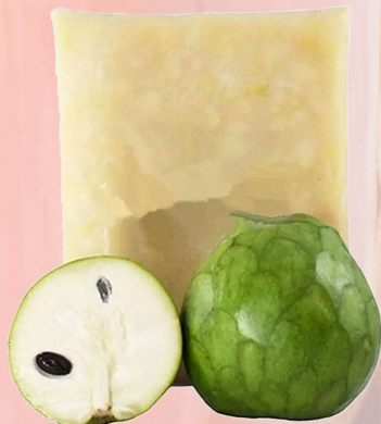
PULPA CHIRIMOYA T&T 1K