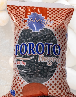
POROTOS NEGROS CAMSA 1K