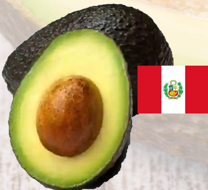
PALTA HASS PERUANA CALIBRE 18-22 1K