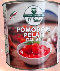
POMODORI PELATI 2500G