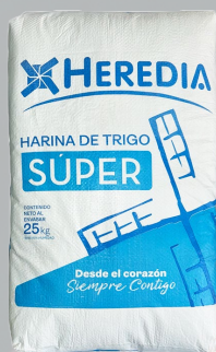
HARINA HEREDIA SUPER 25K