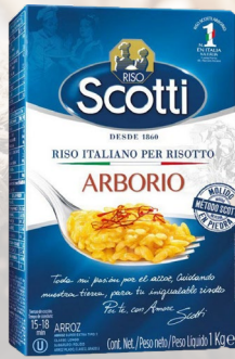
ARROZ ARBORIO ROMA 1K