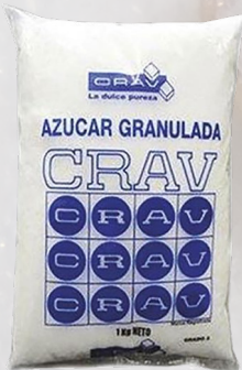
AZÚCAR G2 CRAV 1K