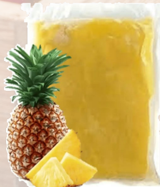
PULPA PIÑA T&T 1K