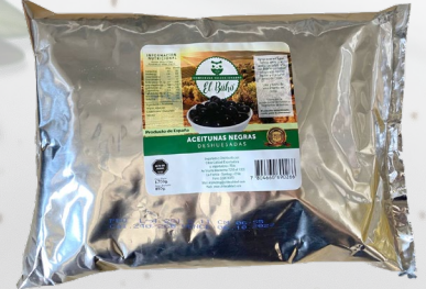
ACEITUNAS NEGRAS DESHUESADAS 1800G