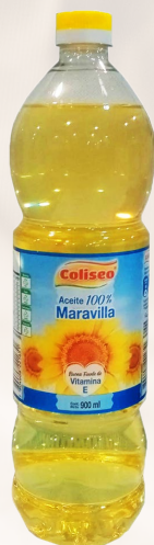
ACEITE MARAVILLA COLISEO 900ML