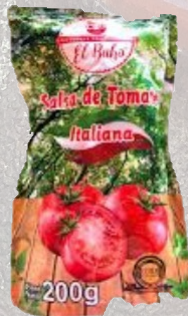
SALSA DE TOMATE 200G