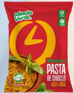
PASTA DE CHOCLO MINUTO VERDE 1K