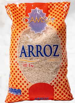
ARROZ G2 CAMSA LARGO FINO 1K