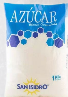
AZÚCAR SAN ISIDRO 1K