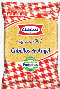
CABELLOS DE ANGEL CAROZZI 400G