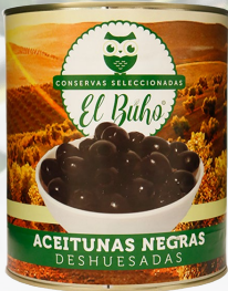
ACEITUNAS NEGRAS DESHUESADAS 3000G