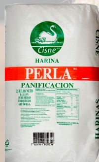
HARINA PERLA 25K