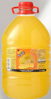
SECEDANEO DE LIMON JUWAI 5LT