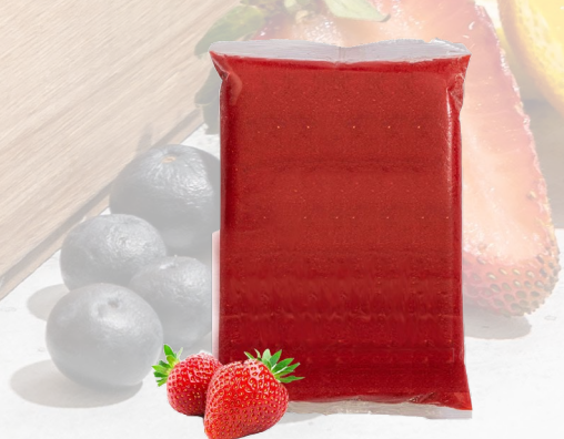
PULPA FRUTILLA T&T 1K