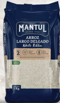
ARROZ G2 MANTUL LARGO FINO 1K