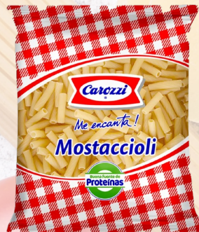
MOSTACCIOLI 46 CAROZZI 400G