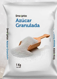
AZÚCAR SMART PRICE 1K