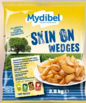
PAPAS FRITAS GAJO CON PIEL 1K