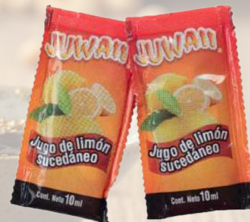
SACHET DE LIMON 10ML