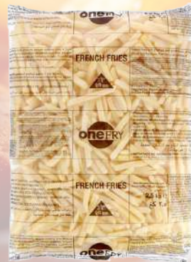
PAPAS FRITAS ONE FRY 9MM 1K