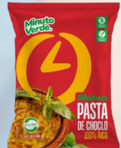
PASTA DE CHOCLO MINUTO VERDE 1K