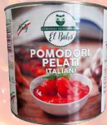
POMODORI PELATI 2500G