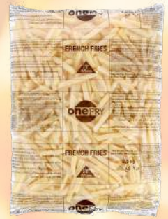
PAPAS FRITAS MCCAIN CASERO 12MM 1K