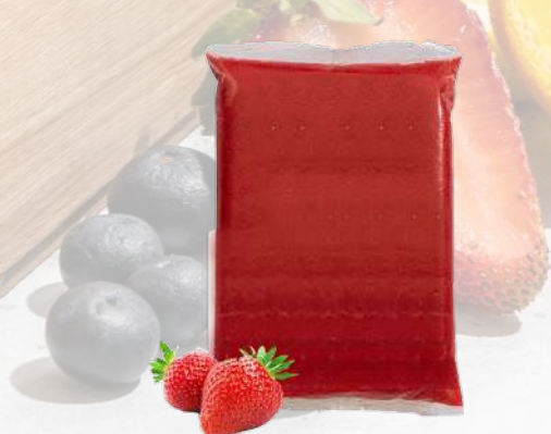
PULPA FRUTILLA T&T 1K