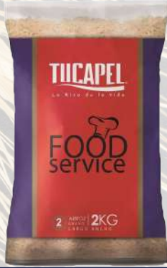
ARROZ TUCAPEL G2 FOOD SERVICE 1K