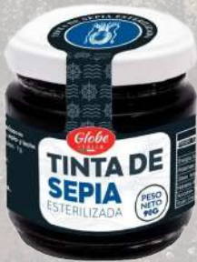
TINTA CALAMAR 90G