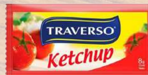
KETCHUP TRAVERSO 8G