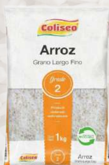
ARROZ G2 COLISEO LARGO FINO 1K