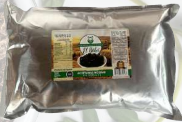
ACEITUNAS NEGRAS RODAJAS 1800G