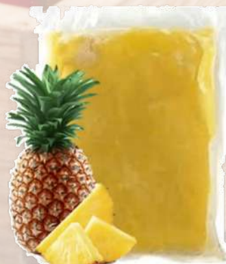
PULPA PIÑA T&T 1K