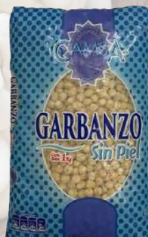
GARBANZOS SIN PIEL CAMSA 1K