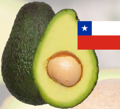
PALTA HASS CHILENA SEGUNDA 1K