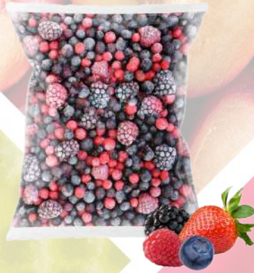
MIX FRUTOS ROJOS IQF T&T 1K