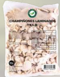
CHAMPIÑONES LAMINADOS INTERAGRO 1K