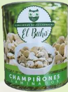
CHAMPIÑONES EL BUHO 2840G