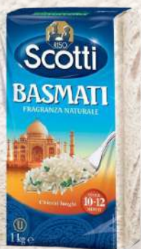
ARROZ ARBORIO BASMATI 1K