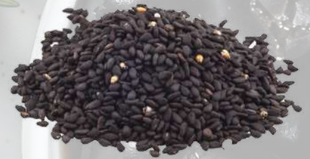
SÉSAMO NEGRO 1K