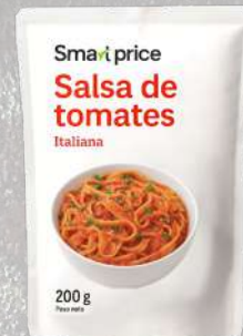
SALSA DE TOMATE SMART PRICE 200G