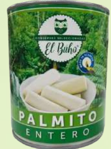
PALMITO ENTERO 800G