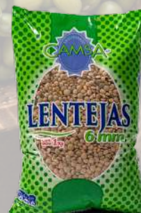
LENTEJAS CAMSA 1K