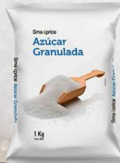
AZÚCAR SMART PRICE 1K