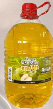
VINAGRE DE MANZANA JUWANI 5LT