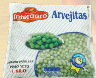
ARVEJAS INTERAGRO 1K