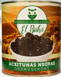
ACEITUNAS NEGRAS DESHUESADAS 3000G