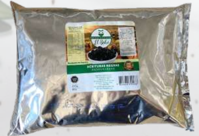
ACEITUNAS NEGRAS DESHUESADAS 1800G