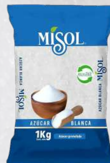
AZÚCAR G2 MISOL 1K