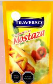
MOSTAZA TRAVERSO 1K