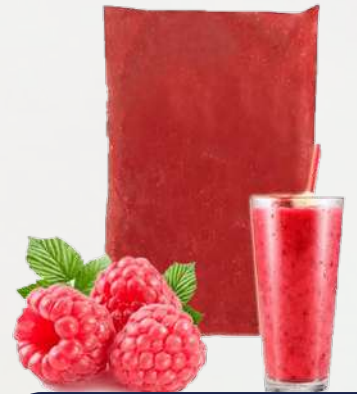
PULPA FRAMBUESA T&T 1K