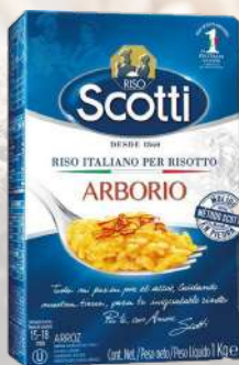
ARROZ ARBORIO ROMA 1K