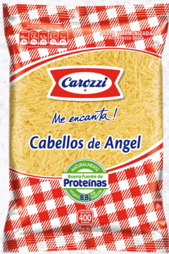
CABELLOS DE ANGEL CAROZZI 400G