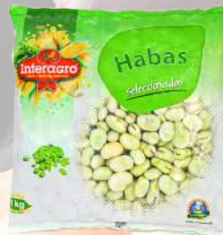
HABAS INTERAGRO 1K