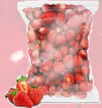
FRUTILLA IQF T&T 1K