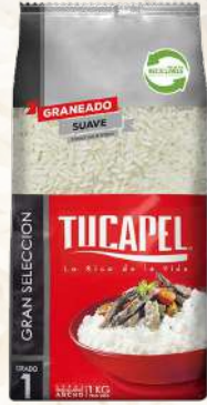
ARROZ TUCAPEL G1 SELECCIÓN 1K