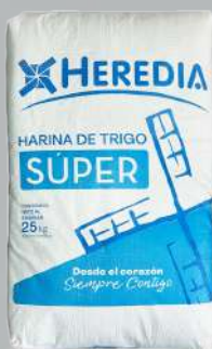
HARINA HEREDIA SUPER 25K