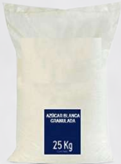
AZÚCAR GRANULADA 25K