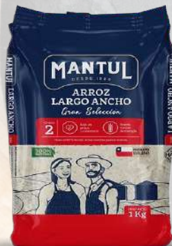
ARROZ G2 MANTUL LARGO ANCHO 1K