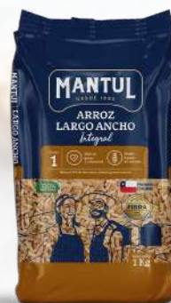
ARROZ G1 MANTUL INTEGRAL LARGO ANCHO 1K