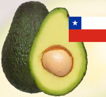
PALTA HASS CHILENA EXTRA 1K