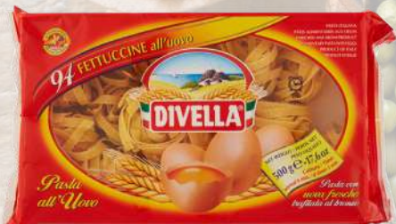
FETTUCCINE DIVELLA 500G