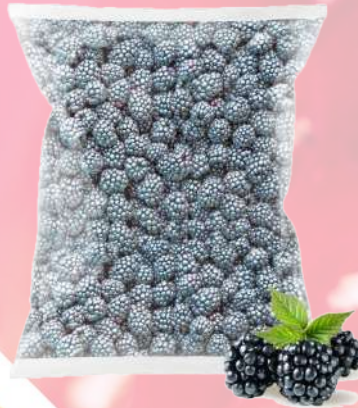
MORA IQF T&T 1K