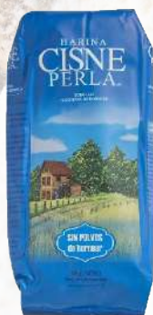
HARINA PERLA 1K