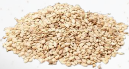
SÉSAMO BLANCO 1K