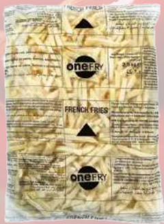
PAPAS FRITAS ONE FRY 12MM 1K