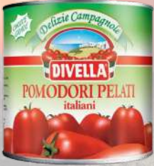
TOMATES PELADOS 2500G