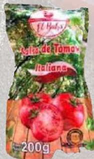
SALSA DE TOMATE 200G