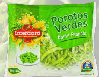
POROTOS VERDES INTERAGRO 1K