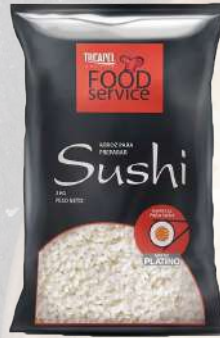
ARROZ TUCAPEL G2 SUSHI 1K