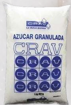
AZÚCAR G2 CRAV 1K