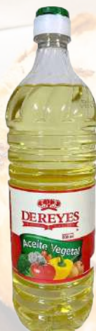
ACEITE VEGETAL LOS REYES 900ML