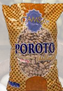
POROTOS CAMSA 1K