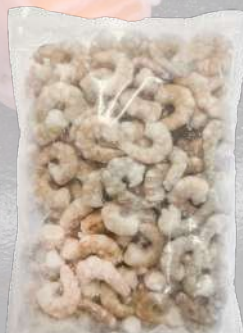
CAMARÓN CRUDO DESVENADO 36/40 1K