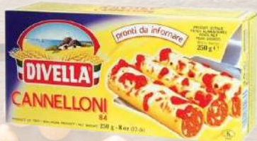
CANNELLONI DIVELLA 500G