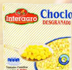
CHOCLO DESGRANADO INTERAGRO 1K