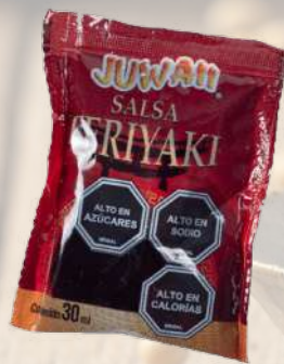
SACHET DE SALSA TERIYAKI 30ML