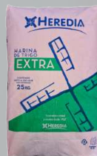
HARINA HEREDIA EXTRA 25K