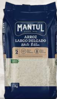
ARROZ G2 MANTUL LARGO FINO 1K