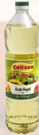
ACEITE VEGETAL COLISEO 900ML