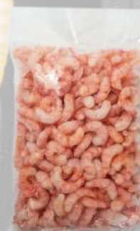
CAMARÓN COCIDO 36/40 1K