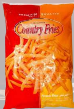
PAPAS FRITAS COUNTRY FRIES 12MM 1K