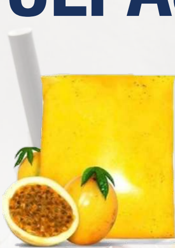
PULPA MARACUYA T&T 1K