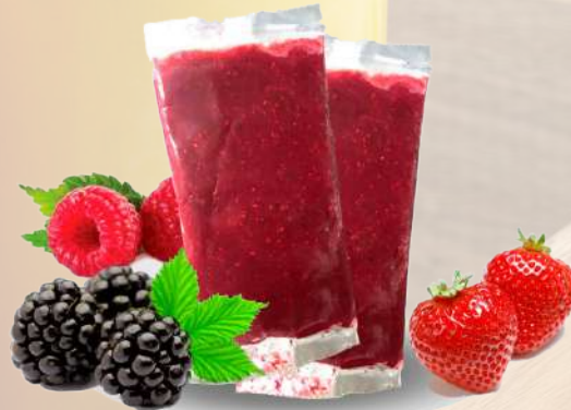
PULPA FRUTOS ROJOS T&T 1K