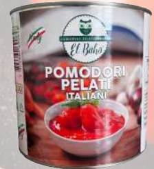
POMODORI PELATI 800G