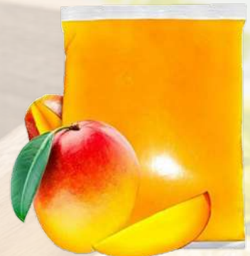
PULPA MANGO T&T 1K