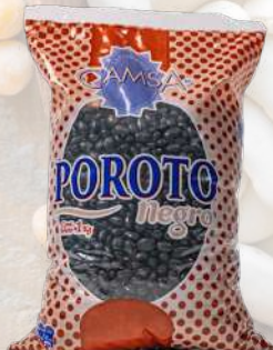
POROTOS NEGROS CAMSA 1K