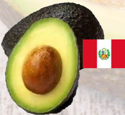
PALTA HASS PERUANA CALIBRE 18-22 1K