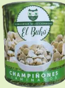
CHAMPIÑONES EL BUHO 400G