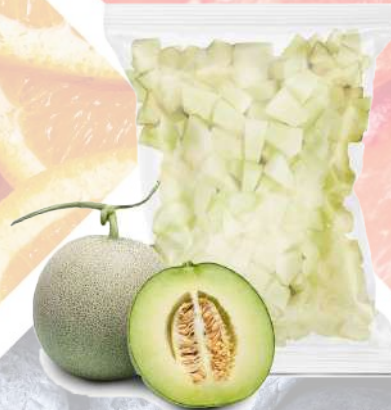
MELÓN IQF T&T 1K