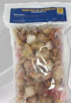
SURTIDO DE MARISCOS EL GOLFO 1K