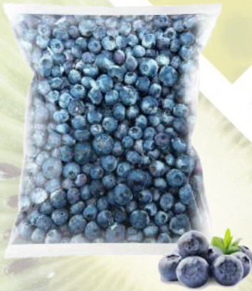
ARÁNDANOS IQF T&T 1K