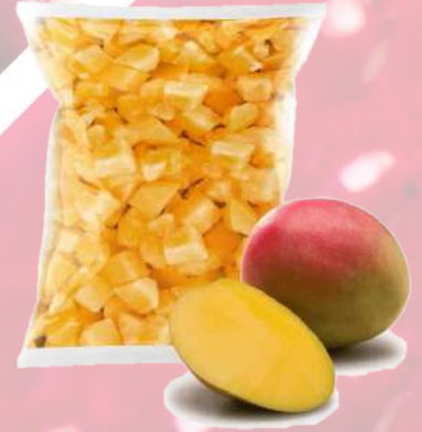
MANGO TROZO IQF T&T 1K