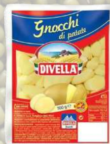
GNOCCHI DIVELLA 500G