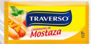
MOSTAZA TRAVERSO 8G