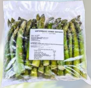
ESPARRAGOS INTERAGRO 1K