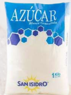
AZÚCAR SAN ISIDRO 1K