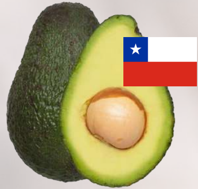
PALTA HASS CHILENA PRIMERA 1K