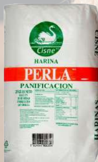
HARINA PERLA 25K