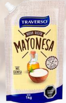
MAYONESA TRAVERSO 1K