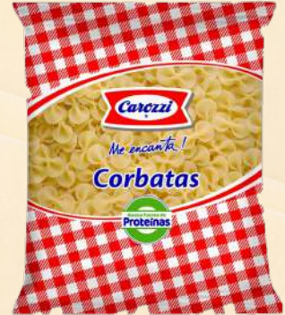
CORBATA 80 CAROZZI 400G