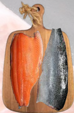
SALMÓN FILETE PREMIUM CON PIEL EL GOLFO 1K