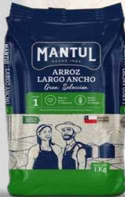
ARROZ G1 MANTUL LARGO ANCHO 1K