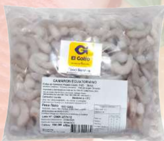
CAMARÓN CRUDO DESVENADO 36/40 ECUATORIANO EL GOLFO 1K