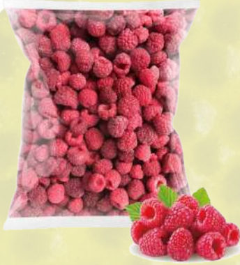
FRAMBUESA ENTERA IQF T&T 1K