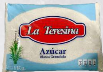
AZÚCAR G2 TERESINA 1K