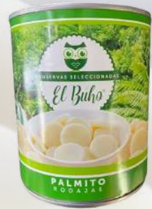
PALMITO RODAJAS 800G