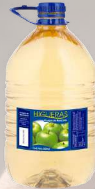
VINAGRE DE MANZANA HIGUERILLAS 5LT