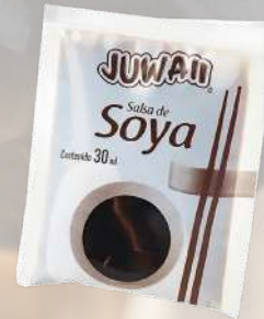
SACHET DE SALSA DE SOYA 30ML