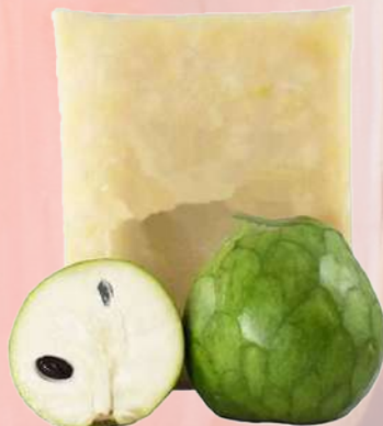
PULPA CHIRIMOYA T&T 1K