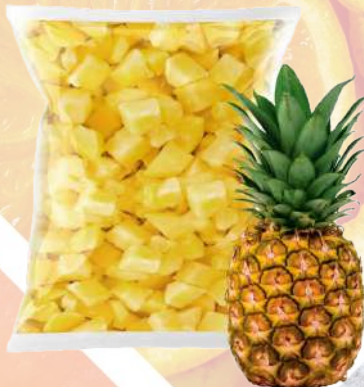
PIÑA TROZO IQF T&T 1K