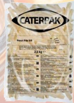
PAPAS FRITAS CATERPAK 12MM 1K