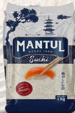
ARROZ G2 MANTUL SUSHI 1K