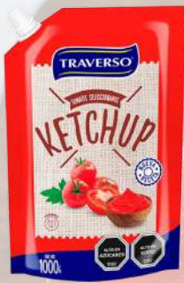
KETCHUP TRAVERSO 1K