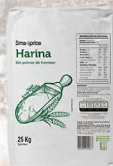
HARINA SMART PRICE 25K