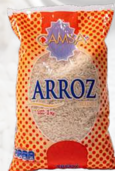
ARROZ G2 CAMSA LARGO FINO 1K