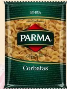
CORBATAS PARMA 400G