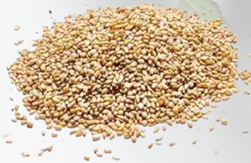
SÉSAMO TOSTADO 1K