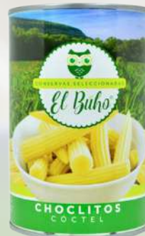
CHOCLITOS CACKTAIL 425G