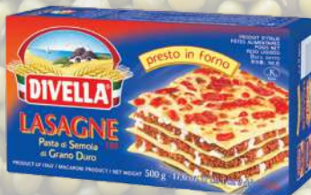
LASAGNA DIVELLA 500G