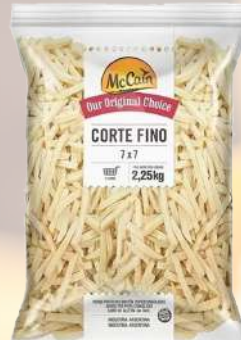
PAPAS FRITAS CORTE FINO 7MM 1K