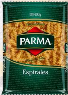
ESPIRALES PARMA 400G