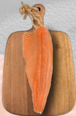
SALMÓN FILETE PREMIUM SIN PIEL EL GOLFO 1K