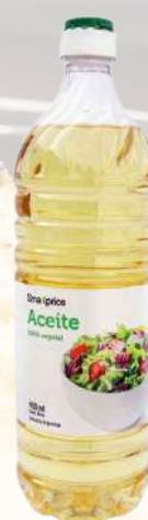
ACEITE VEGETAL SMART 900ML