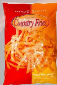
PAPAS FRITAS COUNTRY FRIES 10MM 1K