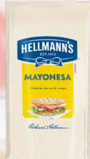
MAYONESA HELLMANNS 940G