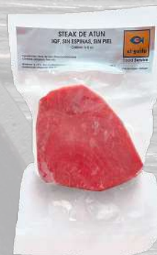
ATÚN STEAK EL GOLFO 1K