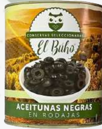
ACEITUNAS NEGRAS RODAJAS 3000G