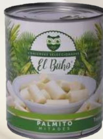
PALMITO MITADES 800G