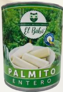
PALMITO ENTERO 400G