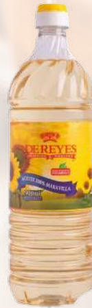
ACEITE MARAVILLA DE REYES 900ML