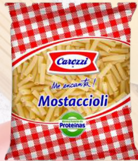
MOSTACCIOLI 46 CAROZZI 400G