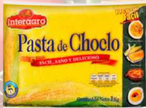
PASTA DE CHOCLO INTERAGRO 1K