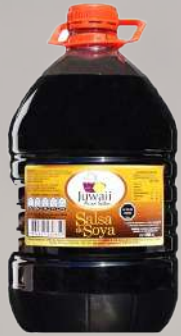
SALSA DE SOYA JUWANI 5LT