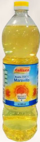
ACEITE MARAVILLA COLISEO 900ML