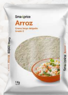
ARROZ G2 SMART PRICE LARGO FINO 1K