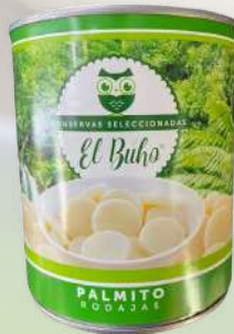
PALMITO RODAJAS 400G