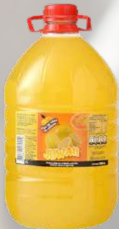
SECEDANEO DE LIMON JUWANI 5LT