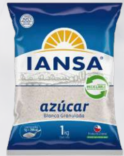
AZÚCAR IANSA 1K