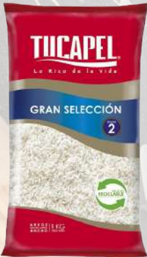
ARROZ TUCAPEL G2 GRAN SELECCIÓN 1K