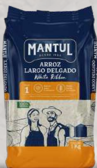
ARROZ G1 MANTUL LARGO FINO 1K