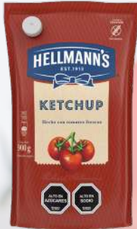
KETCHUP HELLMANNS 1K