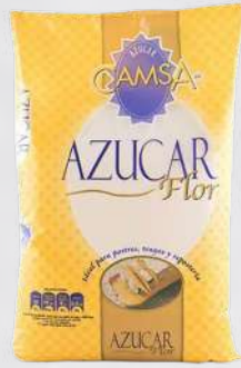
AZÚCAR FLOR CAMISA 1K