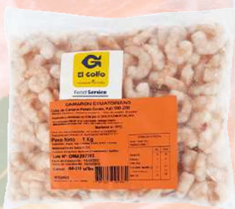
CAMARÓN COCIDO 36/40 ECUATORIANO EL GOLFO 1K