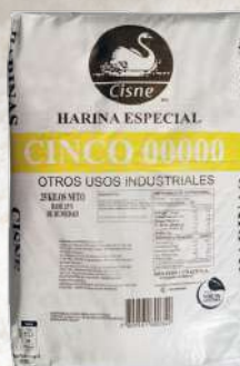
HARINA CINCO CERO 25K