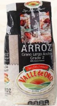
ARROZ G2 VALLE DE ORO LARGO ANCHO 1K