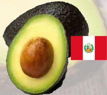
PALTA PERUANA CALIBRE 22-24 1K